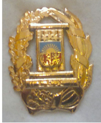
Goda nozīmes fotogrāfija

Zvērinātu advokātu goda nozīmi izgatavo no apzeltīta metāla pēc šajā pielikumā ietvertā zīmējuma un fotogrāfijas, un tā attēlo ovālu ozola un lauru lapu vainagu, kas pārvīts ar lentu. Vainaga vidū četru vertikāli novietotu grāmatu muguras, kuras sedz mazais valsts ģerbonis. Šīm grāmatām horizontāli virsū viena un apakšā divas grāmatas, pie kam uz apakšējās grāmatas muguras uzraksts „Lex”. Mazais valsts ģerbonis attēlots krāsās. Nozīmes izmēri: augstums 2.5 cm un platums 2 cm.