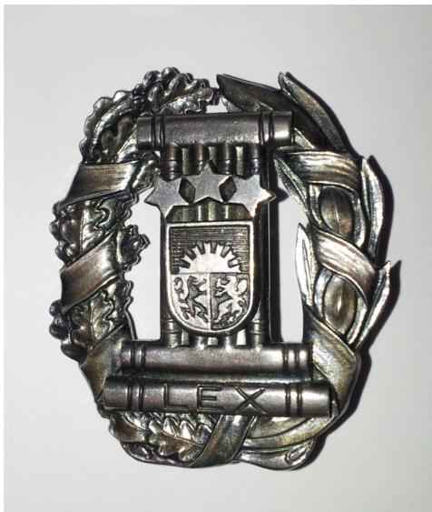
Amata nozīmes fotogrāfija

Zvērinātu advokātu amata nozīmi (kura savulaik tika izstrādāta pēc 1924.gada 23.maija Latvijas zvērinātu advokātu pilnsapulces uzdevuma Latvijas Zvērinātu advokātu padomei ieviest zvērinātu advokātu nozīmi ar valsts ģerboni un uzrakstu „Lex”) izgatavo no sudraba pēc šajā pielikumā ietvertā zīmējuma un fotogrāfijas, un tā attēlo ovālu ozola un lauru lapu vainagu, kas pārvīts ar lentu. Vainaga vidū četru vertikāli novietotu grāmatu muguras, kuras sedz mazais valsts ģerbonis. Šīm grāmatām horizontāli virsū viena un apakšā divas grāmatas, pie kam uz apakšējās grāmatas muguras uzraksts „Lex”. Mazais valsts ģerbonis var būt attēlots arī krāsās. Nozīmes izmēri: augstums 3.7 cm un platums 3 cm.